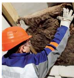
Unifit – univerzální a efektivní zateplení šikmých stře