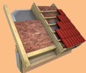
Mezi- a nadkroevní zateplení