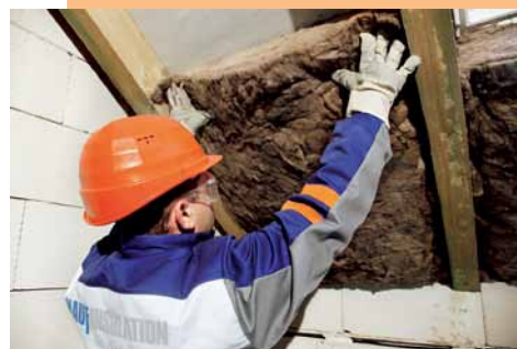
Umístění izolace bočním stlačením