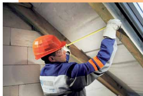
Nařezání potřebné velikosti s doporučeným přesahem