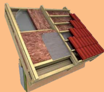
Schéma nadkroevního zateplení

Norma ČSN 73 0540-2 požaduje průkaz odstranění kondenzace uvnitř konstrukce v případech, kdy je případnou kondenzací ohrožena požadovaná funkce celé konstrukce. Tím je míněno zkrácení předpokládané životnosti konstrukce, snížení vnitřní povrchové teploty vedoucí ke vzniku kondenzace a tím ke vzniku plísní, jakékoli objemové změny vznikající s nasákavostí daných materiálů a zhoršení mechanické odolnosti a stability.