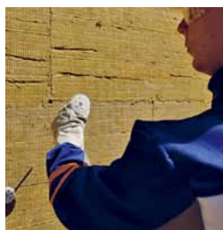
Kontaktní zateplení kamennou izolací