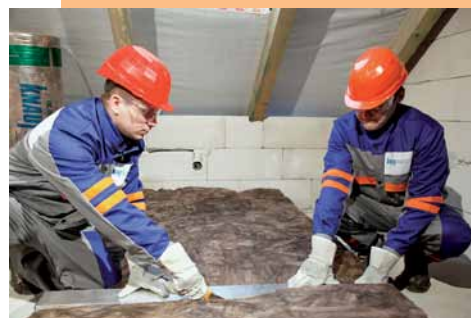
Přesné odměření vzdálenosti (nestačí údaj z projektu!)